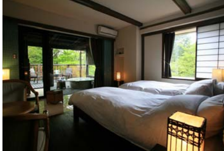
雅芳婷仙石亭酒店

雅芳婷仙石亭酒店整栋住宿的设计概念为“回归自我”。坐落在日本保有原始风景至今仍留存的仙石原中，被自然环抱的这间客栈里，全部客室都备有露天浴池。因此每一位房客都可以随意享受到泡汤的乐趣。此外美味的法式盛宴、有机植物的FONTAINE BLEAU原创化妆品及FONTAINE BLEAU SPA服务等，让你能够得到身体上的放松和满足。是一个再远也要去“追求真实”的地方。