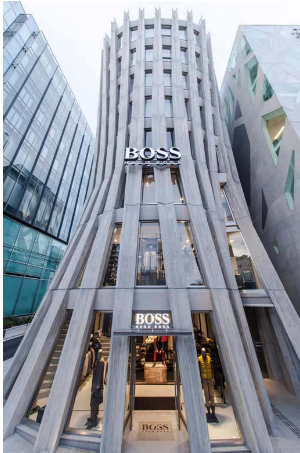
BOSS STORE 表参道外观

建成于2013年的HUGO BOSS在表参道上算得上是比较新的建筑了，建筑风格上处处彰显大楼设计师——团纪彦的“简洁和简练”的理念，让整幢大楼看上去既健壮，又不失高雅。