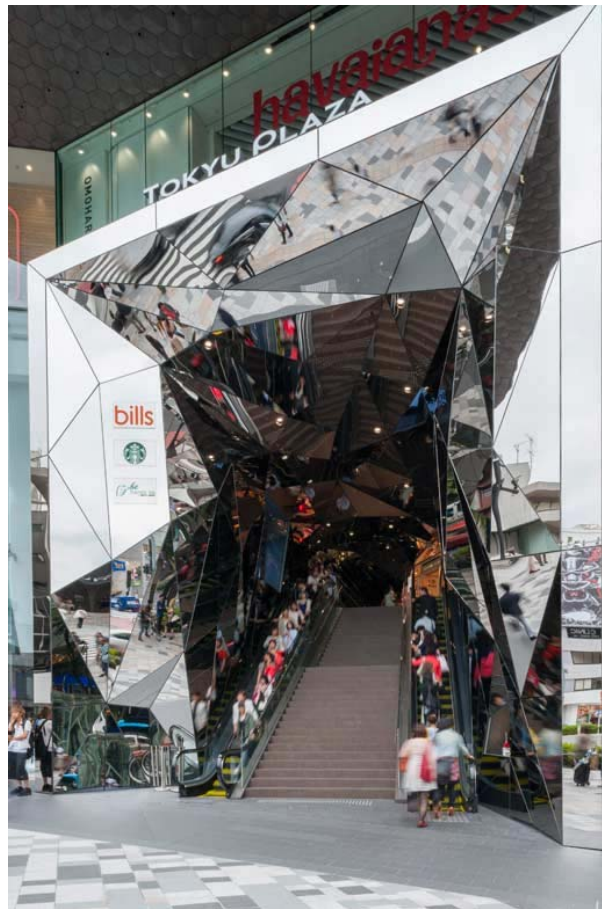
东急广场 (tokyu plaza) 外观