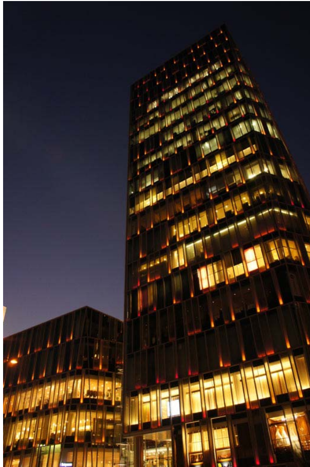
青山Aoi复合式商业大楼外观

青山Aoi复合式商业大楼是2009年建成的又一座地标性建筑。建筑物的名字来源于地址：“青山”（Aoyama）和“相会”（Aoi）这两个单词的日语发音。大楼设计强调绿化与个性的兼备，外面装饰的LED灯到了夜晚点灯时会有水和云的光影跃动，同时配合季节变化会有不同的灯光展示效果。大楼高层为写字楼，低层为商业设施，是一座复合式商业大楼。